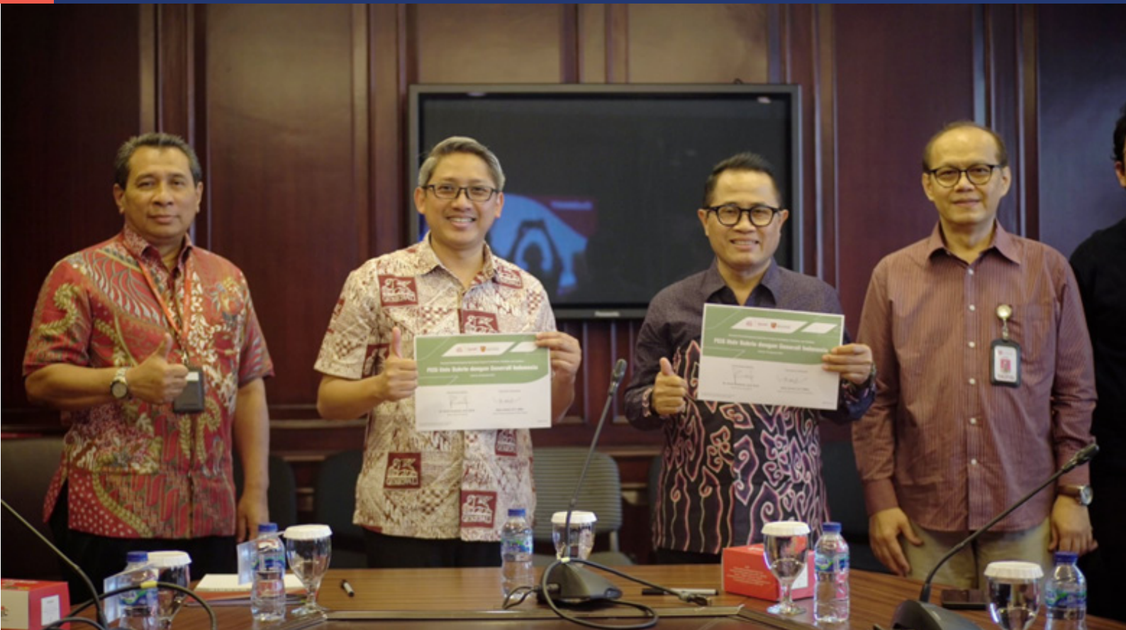
Peluncuran Kerjasama Magang Kerjasa Project-based Design Thinking dengan PT Generali Indonesia