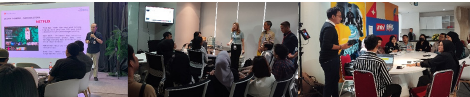
Dokumentasi Pelatihan SDM VIVA Group

Lab Inovasi dan Transformasi melakukan pelatihan design thinking terhadap karyawan VIVA Group pada tanggal 11 dan 18 Oktober 2023 di The Convergence Indonesia . Pelatihan dihadiri oleh karyawan dari tvOne, ANTV, dan media online VIVA.co.id. Fasilitator memaparkan bagaimana karyawan dapat memahami kebutuhan pengguna, merumuskan masalah dan mempresentasikan temuan, solusi, dan ide-ide yang dihasilkan selama tahapan design thinking .