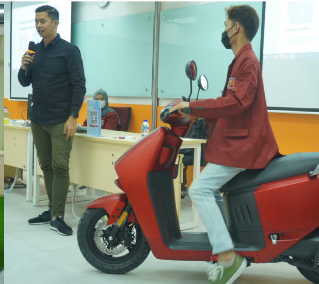
Workshop Design Thinking Manajemen Pemasaran dengan PT VKTR dan Siswa SMA